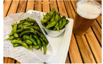
※写真は「枝豆2種盛り」のイメージです。