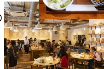
上:ヒルズマルシェでおばんさい 旬のランチプレート 下:2017年 ビストロヒルズマルシェ開催の様子