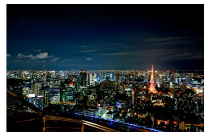
屋上「スカイデッキ」から見える夜景

期 間： 7月14日(土)～8月26日(日) 延長時間： 営業時間を 22:00 まで延長(最終入場 21:30) ※強風、雨天、荒天時はクローズとなります。