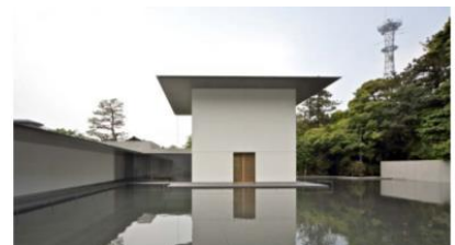
谷口建築設計研究所《鈴木大拙館》2011 年 金沢