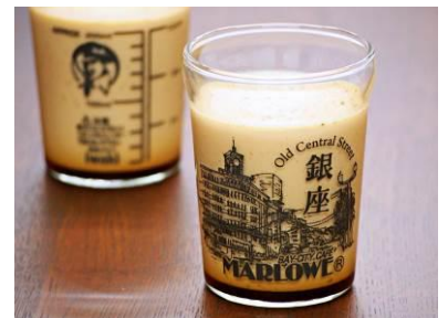
マーロウ [B2F] 銀座店限定ビーカー入りプリン 800 円