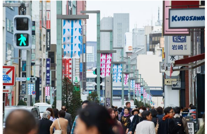
GINZA SIX 中央吹き抜けの新作インスタレーションと連動したアート作品を全長1,100メートルの銀座・中央通りに展示(イメージ)

《Like a flock of starlings: work in situ》Daniel Buren 2018 © DB - ADAGP, Paris & JASPAR, Tokyo, 2018 G1226