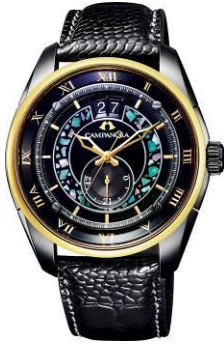
CITIZEN FLAGSHIP STORE TOKYO [1F] Campanola メカニカルコレクション GSIX 限定セット 1,250,000 円