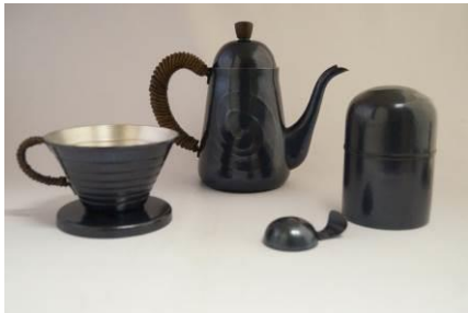
玉川堂 [4F] コーヒーポット(700ml) 170,000 円 コーヒーストッカー(100g)スプーン付 60,000 円 ドリッパー 35,000 円