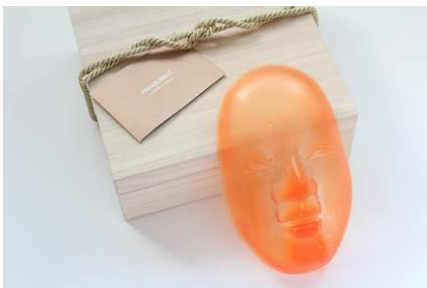
PAPABUBBLE [B2F] 飴で作った能面桐箱入り 4,630 円