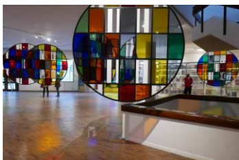
《半円から円へ: 色彩の旅》展示風景、ボコタ近代美術館、ボコタ、コロンビア、2017年 © DB - ADAGP, Paris & JASPAR, Tokyo, 2018 G1226