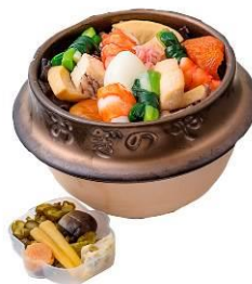
荻野屋 [B2F] GINZA SIX 1周年記念 釜めし 祥 3,900 円