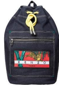
KENZO [3F] Memento N°2 mini backpack 36,000 円