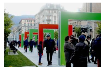
《歩く》展示風景、恒久設置、ヴェルディ・広場、ラ・スペツツィア、イタリア、2016年 © DB - ADAGP, Paris & JASPAR, Tokyo, 2018 G1226