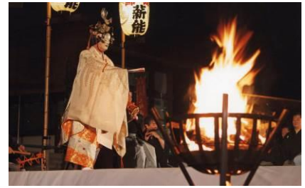
※上記は薪能のイメージ写真であり、実際の公演内容とは異なります。

※参加条件等の詳細は後日GINZA SIX公式WEBサイトにてお知らせいたします。