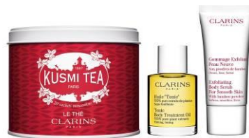
CLARINS [B1F] 紅茶とスキンケアのセット 6,500 円