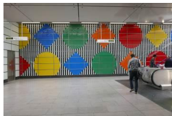
《四角と円》恒久設置、トッテンハム・コート・ロード駅、ロンドン、イギリス、2008-2017年 G1226