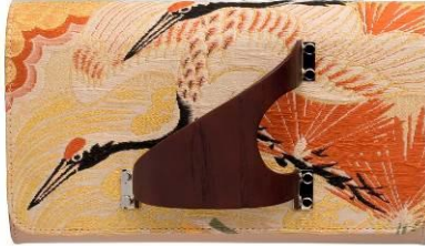
PERRIN [2F] KIMONO CLUTCH BAG 166,000 円