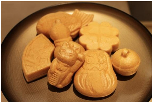
KUGENUMA SHIMIZU [B2F] KUGENUMA SHIMIZU もなか 福