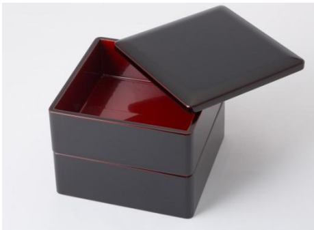
中川政七商店 [4F] 漆琳堂 お重