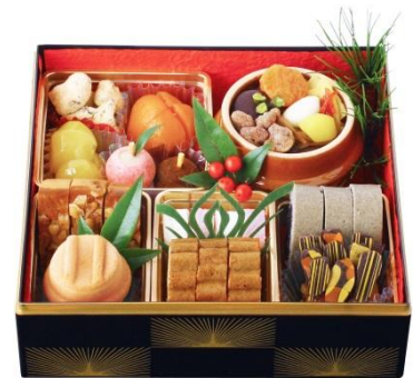
荻野屋 [B2F] 荻野屋/ドルチェ・エスタシオンの 「スイーツおせち」