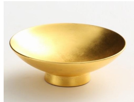
漆器 山田平安堂 [4F] 平盃 金箔