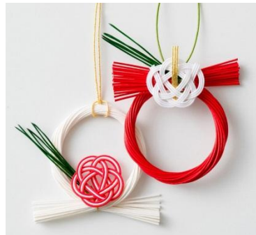
CIBONE CASE [4F] TIER お飾り