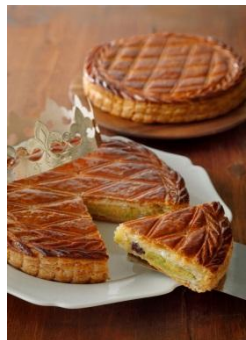
ル・ブルーランジェ・ドゥ・モンジュ [B2F] ガレット デ ロワ