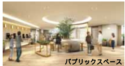
パブリックスペース

同フロアには、ビジネスコンビニ「ヒルズ 21」、「外貨両替ワールドカレンシーショップ」、靴リペア「ミスターミニット」、旅行代理店「H.I.S.」、「ATM」に加え、洋服のお直しサービスを行う「お直しコンシェルジュ ビック・ママ」と「加熱式タバコ専用ルーム」を新設、オフィスサポート機能を集約、拡充しました。