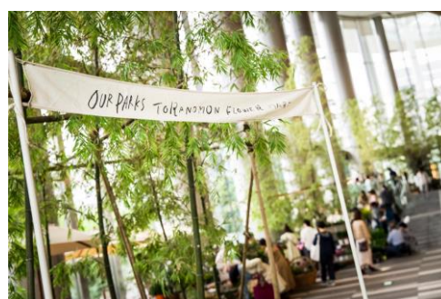
虎ノ門フラワーマーケット 過去開催の様子