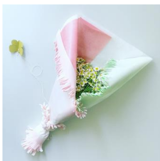
「おはなを包むワークショップ」 完成イメージ