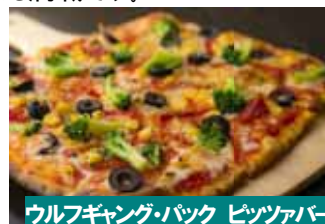
ウルフギヤング・バック ピッツァバー