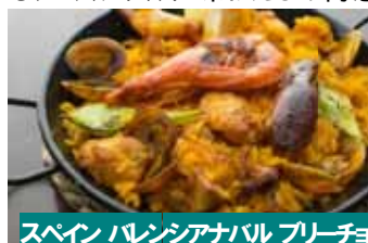
スペイン バレンシアナバル フリーチョ

ガツンとお腹を満たす主役級のメニューが盛り沢山。パエリアやピザ、お好み焼きなど、大人数でシェアするのも。バラエティあふれる和洋折衷なラインナップで展開します。店舗よりもリーズナブルに味わえるお得感も満載です。