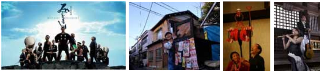
(左)雅轟太鼓、(中央左)ちっち、(中央右)江戸太神楽 丸一仙翁社中、(右)竹弦囃子