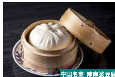
中国名菜 陳麻婆豆腐