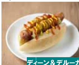
ディーン&デルーカ