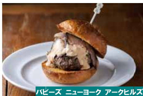
バビーズ ニューヨーク アークヒルズ

食欲の秋にふさわしい肉づくしのメニューも登場。毎年大人気のボリューム満点バーガーや、ほくほくの肉まん、華都飯店からは、中華風牛丼がラインナップ。キノコやサツマイモなどの旬食材もたっぷり使った秋の味覚丼です。