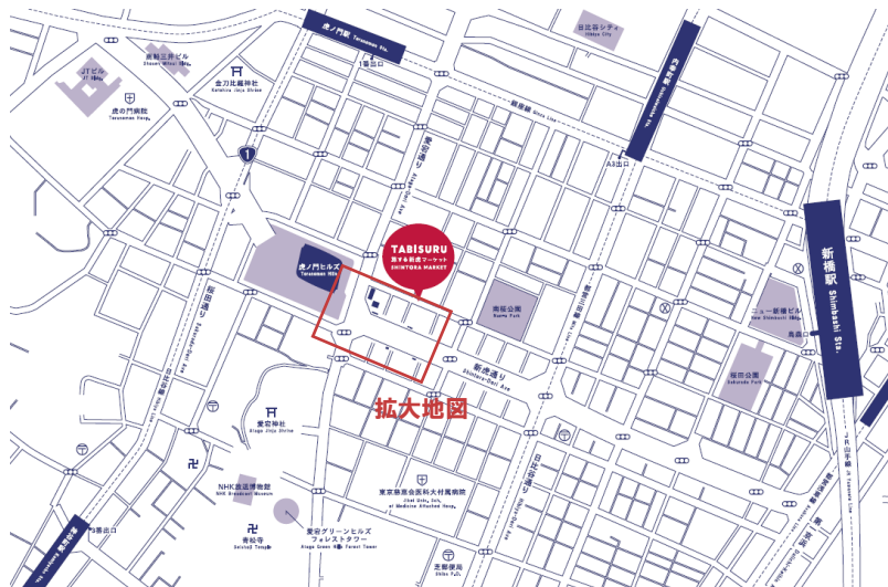
旅する新虎マーケットエリア地図