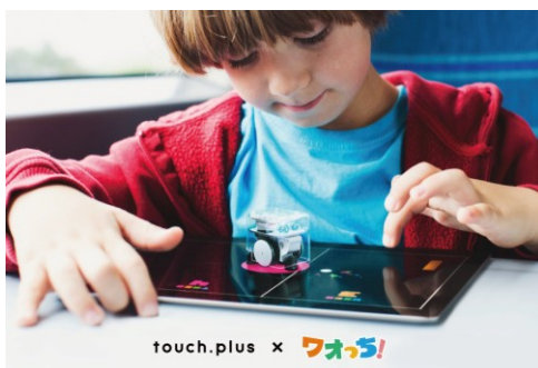
touch.plus × ワオっち! 画像