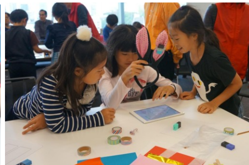
ソニー MESH プロジェクト画像