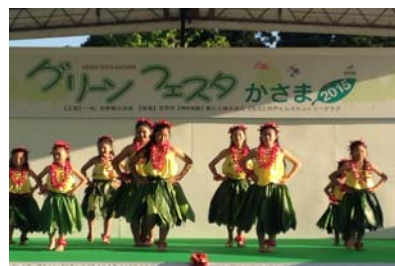
「グリーンフェスタかさま」