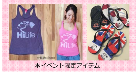
本イベント限定アイテム