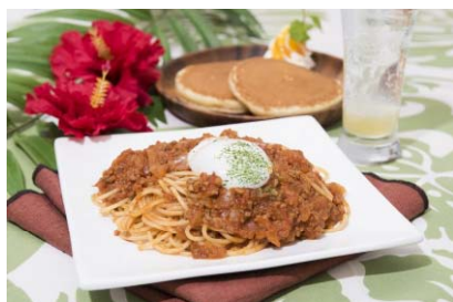
AROUND TABLE 「1F」 OHANAセット (税込1,500円) ※1日20食限定