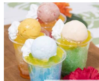
ジェラフル ソロウーノ 「1F」 ハワイアン・シャリッペ (各 税込490円)