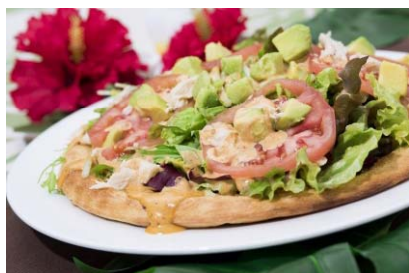
パドリーノ・デル・ショーザン 「2F」 コブサラダピッツア (税込1,750円)