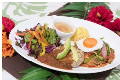
タントタント 「3F」 ロコモコナポリタン (税込1,380円)