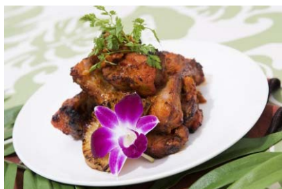
東京李朝園 「2F」 食べてコリアン!スぺアリブ! (税込1,480円) ※数量限定