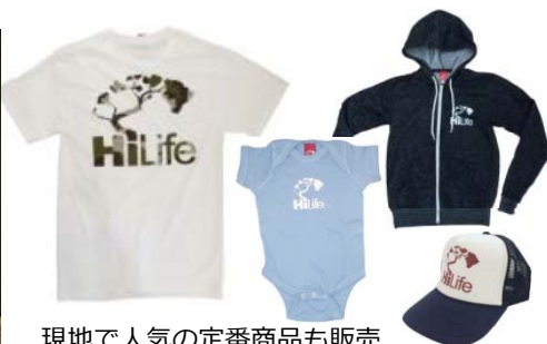
現地で人気の定番商品も販売