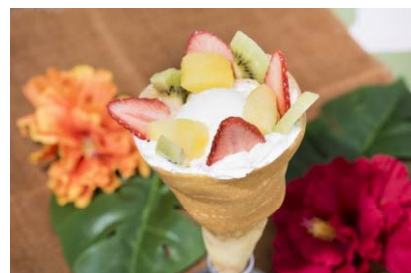
MOMI & TOY'S 「2F」 フレッシュフルーツのヨーグルト パフェのクレープ (税込650円)