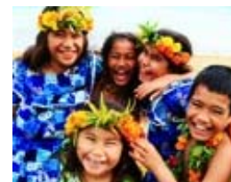
花冠や伝統工芸のワークショップ