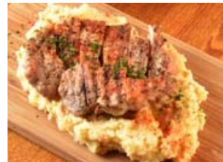
【ワンスキッチン】 タヒチアンセット (イペリコ豚× ココナッツポテトサラダ× スパークリングワインのセット)