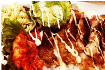
【パラダイス】 スペシャルコンボ (アボカドタコライス &ガーリックシュリンプ)