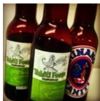
地ビール「ヒナノタヒチ」