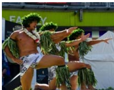
「TAHITI ORA」 タヒチ最大の祭典「HEIVA I TAHITI 2014」で総合優勝したプロタヒチアンダンスグループ