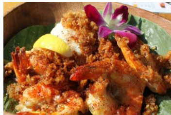
【マハロハ】 タヒチアン ココナッツ ガーリックシュリンプ