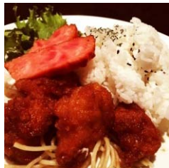
【ピンクココナッツ】 タヒチアングリルプレート (プアロティノ プレオコカ ノライス)