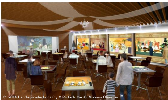
© 2014 Handle Productions Oy & Pictack Cie © Moomin Character™