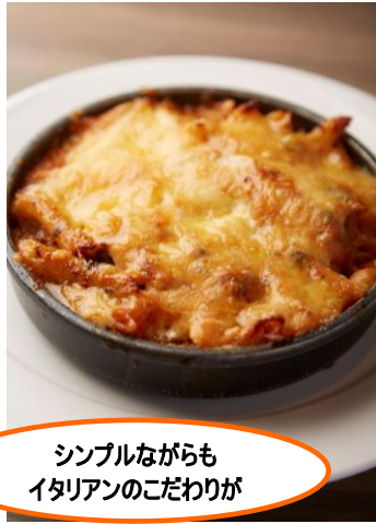
ヒルズ ダル・マツ (ウェストウオーク 5F)