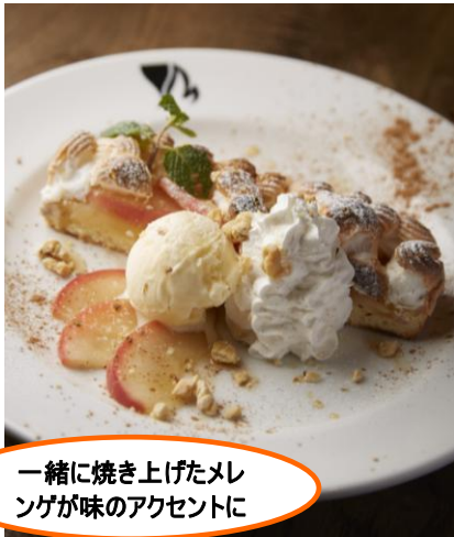
エーダブリュ エレメンツ (ヒルサイド B2F)