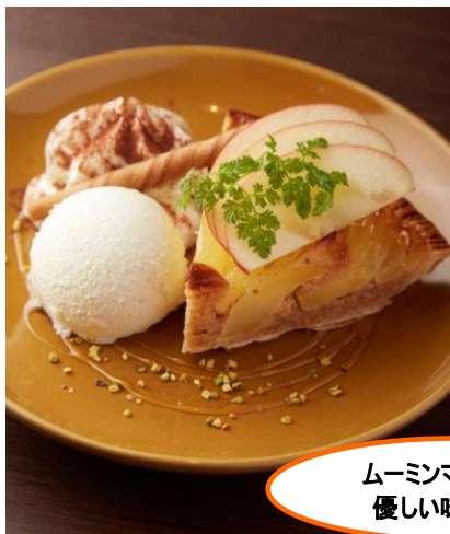
イー・エー・グラン (ウェストウオーク 4F)