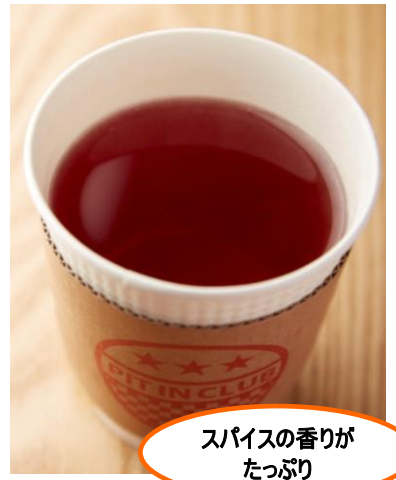
ピットインクラブ (ウェストウオーク 6F)