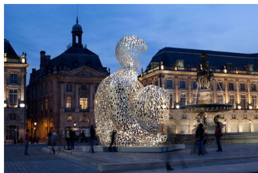
House of Knowledge 2008年 フランス・ボルドー市での展示風景 (2013年)

《ルーツ》は8つの言語の文字が、膝をかかえて座る人間をかたどっており、多様な文化を越えた人間の平和的な共存を象徴しています。夜間は、ライトアップされ、昼間とは異なる独特のシルエットが浮かび上がり、幻想的な雰囲気を醸し出します。