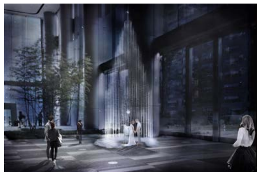
Toranomom White Forest (イメージ)