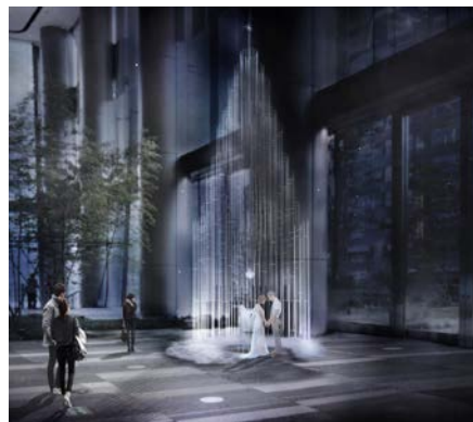
Toranomom White Forest (イメージ)