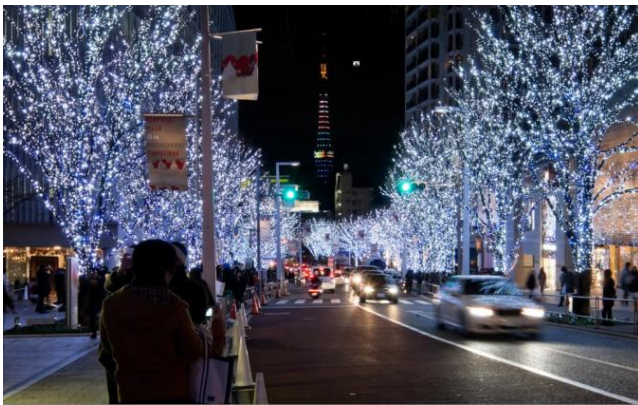
冬の風物詩となった樹氷の並木道。寒色系のイルミネーション“SNOW&BLUE”