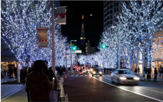
寒色系のイルミネーション “SNOW&BLUE”