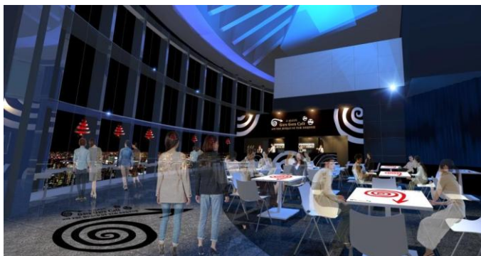
J-WAVE GURU GURU Café イメージ