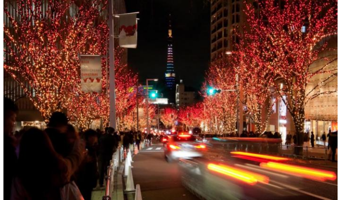
暖色系のイルミネーション “CANDLE&RED”