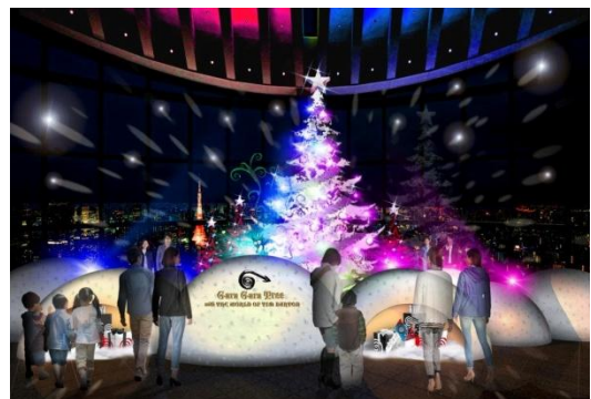
GURU GURU TREEイメージ