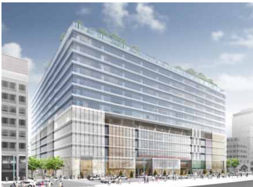
銀座「中央通り」から見た施設外観イメージ 今後変更になる場合があります

また、屋上庭園や観光バス等の乗降スペース等による来街者を迎え入れる施設の導入、安全で快適な交通・歩行者ネットワークの強化・拡充、さらに、非常用発電設備や防災用備蓄倉庫等も整備し、地域に開かれた場所として、来街者の利便性と快適性を高めるとともに、災害時の地域全体の防災機能向上も図ります。