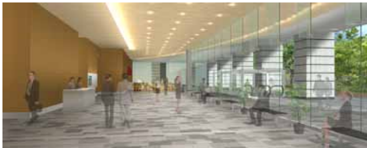
エントランス空間イメージ

駅直結の高品質かつ開放的なオフィス（約1,900㎡、天井高2.9mの整形フロア） オフィスは約1,900㎡の整形フロアであり、レイアウトの自由度が高く、現代の多様なニーズに応えられるよう最先端のスペックを整えました。 天井高もトップクラスの2.9mを確保し、高品質かつ開放的なオフィス空間を提供します。 また、六本木一丁目駅にも直結し、アクセス面の優位性も特徴です。