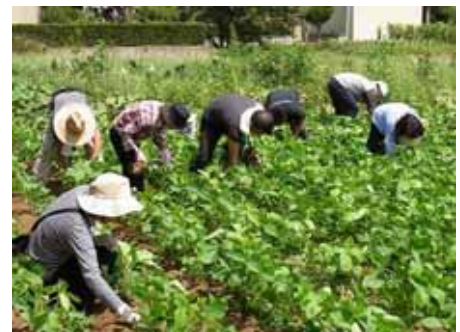
[写真]「農業ルーキーズクラス」の農業体験の様子