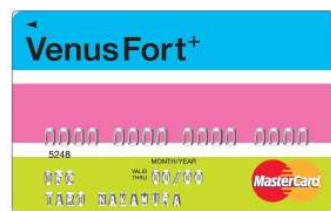
<ヴィーナスフォートパスポート プラス>