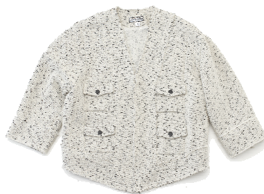
キワシルフィー(本館B1F) クリスベンツ 164,850円→98,910円(40%OFF)