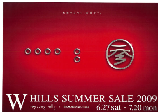
W HILLS SUMMER SALE 2009 共通ヴィジュアル