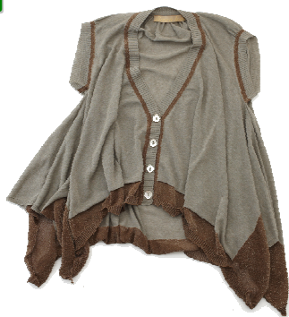
イリアンローヴ(本館B1F) ラメカーディガン 30,450円→21,315円(30%OFF)