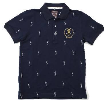
マーク&ロナ プラス(本館B3F) ポロシャツ(ネイビー) 17,640円→12,348円(30%OFF)