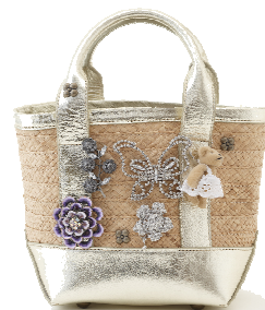
フリーストア(本館B1F) ラフィアNEWブローチート 15,750円→9,450円(40%OFF)