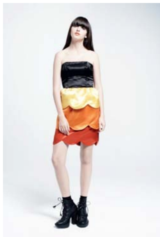
Peter Jensen for TOPSHOP