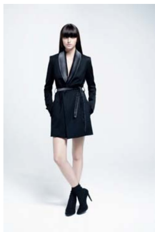
Todd Lynn for TOPSHOP