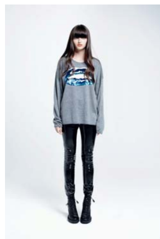
Markus Lupfer for TOPSHOP