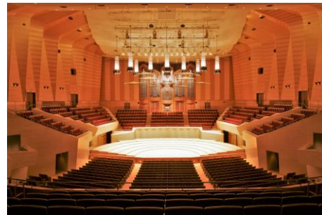
東京初のコンサート専用ホール