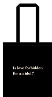
映画『恋愛裁判』オリジナルトートバッグ