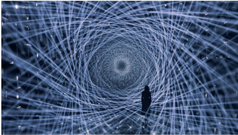
チームラボ「Asymmetric Existence」シリーズ