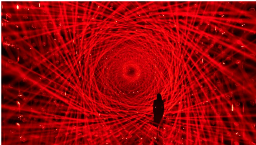
チームラボ「Asymmetric Existence」シリーズ © チームラボ

ミラーの面は、単に実空間を対称的に反射する境界面ではなく、実空間と鏡像空間に現れた存在を接続する場となる。Asymmetric Existence は、彫刻を、実空間に閉じた物体から、実空間と鏡像空間を横断し、認識の中で統合される存在へと拡張する試みである。