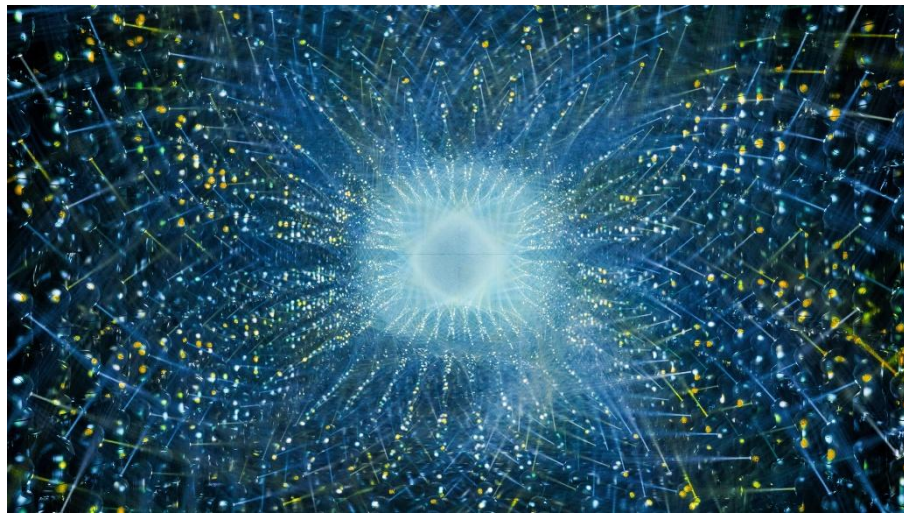
チームラボ「Asymmetric Existence」シリーズ © チームラボ