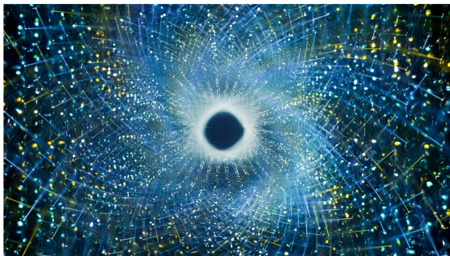
チームラボ「Asymmetric Existence」シリーズ © チームラボ