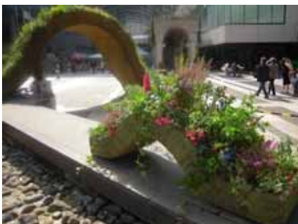
SMALL Bridge of Plants（アーク・カラヤン広場）