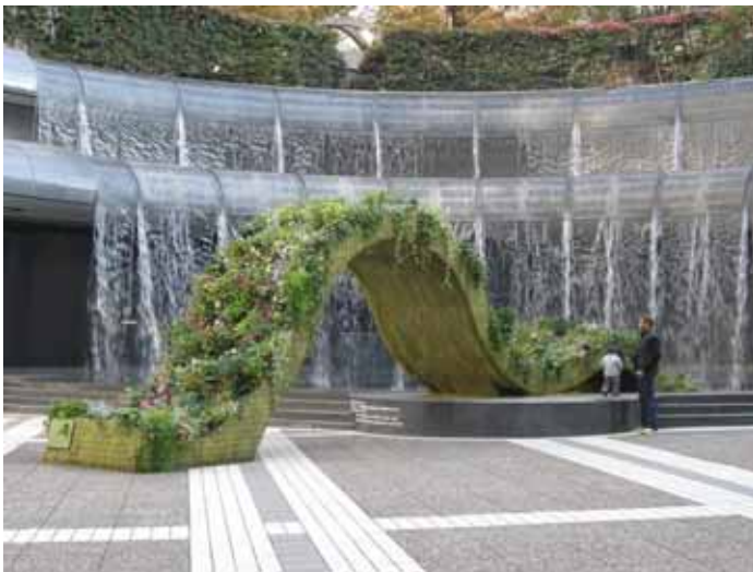
Bridge of Plants（アーク・カラヤン広場）

今にも動き出しそうに波を打ち、緩やかなカーブを描く緑の帯は、200種類以上の植物同士が隣り合わせ、光を受けて細胞が広がるように枝を伸ばし、根を広げ合います。冬に植えられた植物は春に向けて芽を出しその姿を変化させます。3月からは、ヒルズの緑を育むヒルズガーデニングクラブの会員と東氏のコラボレーションにより、5体の“SMALL Bridge of Plants”が登場。その姿は、アークヒルズを中心に都市を多様な緑で包んでゆく、森ビルの街づくり・エリアマネジメントを象徴するかのような日々変化する作品です。