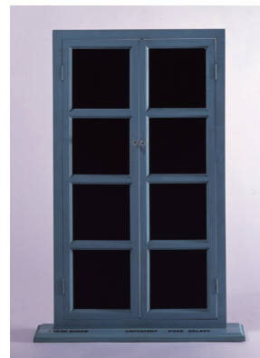
マルセル・デュシャン 《フレッシュ・ウィドウ》 1920年/1964年 木、ガラス 79.0 x 54.1 x 10.8 cm 所蔵：広島市現代美術館 © Succession Marcel Duchamp / ADAGP, Paris & SPDA, Tokyo, 2011

※開幕時には、サーダン・アフィフの作品《どくろ》、カデル・アッティアとクロード・レヴェックの作品が展示されません。 状況に応じて展示する予定ですので、展示時期に関しては直接お問い合わせください。