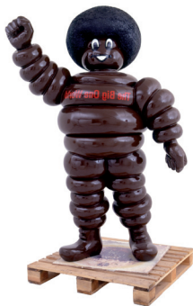
ブリュノ・ベナド 《無題、大きな一つの世界》 2000年 発泡スチロール、樹脂、ポリウレタン塗料、木 240 x 170 x 100 cm ポワトゥー・シャラント地域現代芸術振興基金蔵、 フランス Photo: Christian Vignaud Courtesy: Galerie Loevenbruck, Paris © ADACP, Paris & SPDA, Tokyo, 2011