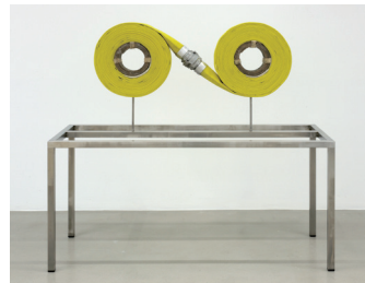
カミーユ・アンロ 《テヴォー》 2010年 ミクスト・メディア 140 x 150 x 60 cm 個人蔵