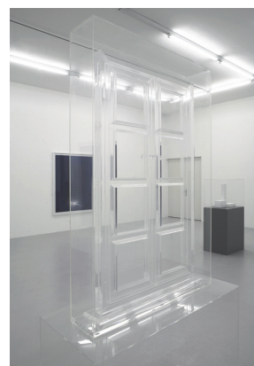
マチュー・メルシエ 《無題》2007年 プレキシグラス 190 x 120 x 50 cm Photo: Sully Balmassière Courtesy: Galerie Lange + Pult, Zurich © ADAGP, Paris & SPDA, Tokyo, 2011