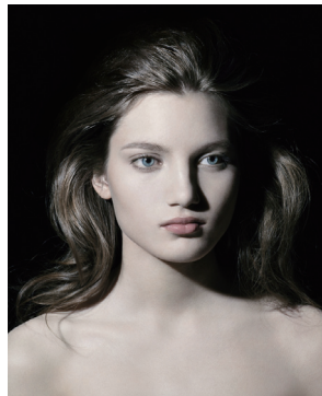
ヴァレリー・ベラン 《無題》 無題、シリーズ《モデルII》より 2006年 ピグメント・プリント、紙、アルミニウムにマウント 125 x 100 cm