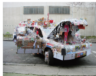
トーマス・ヒルシュホーン 《スピノザ・カー》 2009年 自動車、ボール紙、本、ガラス、紙、 プリント、テープ、フラシタ、ほか 210 x 480 x 220 cm 作家蔵 展示風景: アンリ・ミュルジェ通り、 オーベルヴィリエ、フランス Courtesy: ARNDT, Berlin © ADACP, Paris & SPDA, Tokyo, 2011