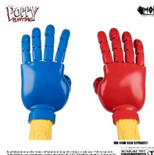
Poppy Playtime グラブパック (ブルー/レッド) 各 5,500 円