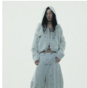
Destroyed Crush Hoodie 25,300 円