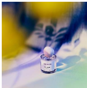
herbalcode 14,000 円

日本発のリチュアルフレグランスブランド SHEEGREEN の POP UP を開催。自然の生命力を表現した全 20 種のフレグランスをフルラインナップで展開し、それぞれの香りが持つストーリーや世界観を体験できる特別な空間をご用意します。ご購入の先着 88 名様にはお好きな香りのミニボトルをプレゼントします。