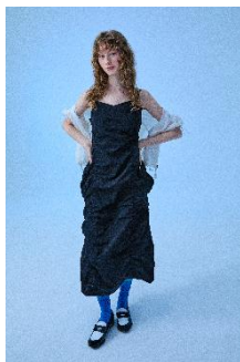
WOMEN'S NYLON BUSTIR DRESS 14,690 円

■ GISELLE がブランドアンバサダーを務める WackyWiLLy サマーシーズン初のポップアップストア開催 あたたかな光と風に満ちるサマーシーズンにぴったりの軽やかなテクスチャーと、自然に流れるロマンチックなシルエットのレイヤードルックをお楽しみください。