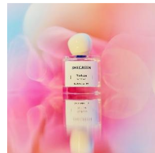
pinkhaze 14,000 円