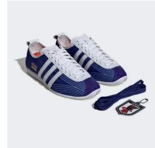
ジャパン JFA ホーム 19,800 円