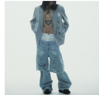
Destroyed Denim and Legcover 29,700 円