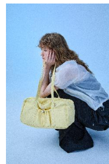
WOMEN'S STRING SHOULDER BAG 10,650 円/ WOMEN'S NYLON SHORT SLEEVE WINDBREAKER 16,040 円