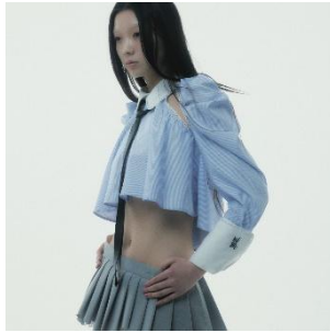
Cleric Flare Shirt 16,500 円