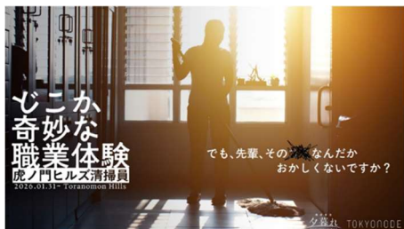
「虎ノ門ヒルズ清掃員」

今回は、TOKYO NODE GALLERY で開催中の現代アート展と連動したリアリティの高い没入型体験となっています。