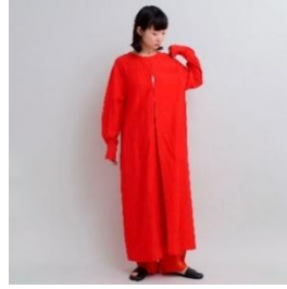
iki Cu/C/Li 桐生シワロング ワンピース