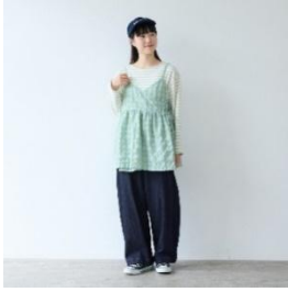
bulle de savon sheer check カシュクール キャミブラウス