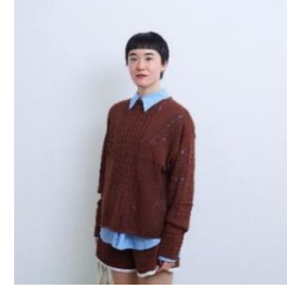
WAAN Collage Knit PO