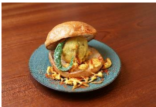
インド料理 ディヤ

参加店舗: インド料理 ディヤ | グランド ハイアット 東京 | 信濃屋 | 鮭鐵/鐵ちゃん | 中国料理 ゴールデンタイガー 南翔饅頭店 | ニャーヴェトナム | 梅蘭 | バルバッコア | ヒルズ ダル・マット | POKEDO MARKET 毛利 サルヴァトーレ クオモ | リゴレットバーアンドグリル | ワインショップ・エノテカ