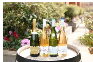
ワインショップ・エノテカ