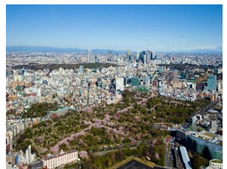
ピンクに色づく青山霊園の桜の十字路

公式サイト： https://tcv.roppongihills.com/jp/news/2026/02/8629/