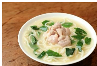
グランド ハイアット 東京