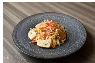
ヒルズ ダル・マット