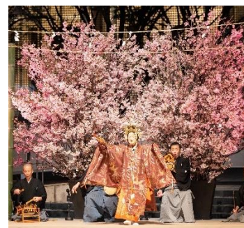
※過去開催時の画像です