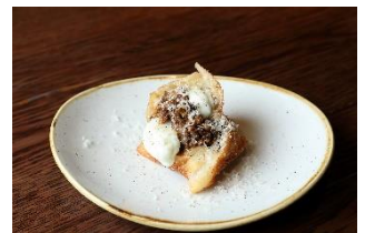
毛利 サルヴァトーレ クオモ