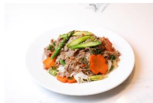
ニャーヴェトナム