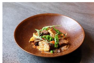
リゴレットバーアンドグリル