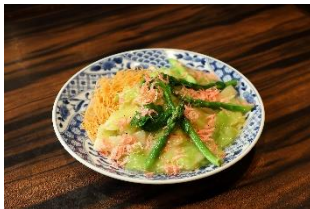
中国料理 ゴールデンタイガー