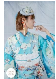
ドットグレープ綿着物(セミオーダー) 48,400 円 トク帽 ホワイト 4,730 円 金魚のイヤーフック 5,500 円 レース半幅帯 白スカラブ 13,200 円 金彩磁帯留 リボン 6,600 円 アンティーク着物 志古貴水色 6,380 円