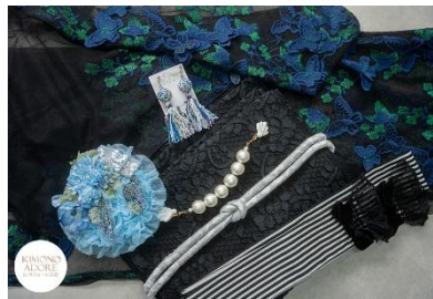
蝶々のチュール羽織 ネイビー 38,500 円 手まりとミックスタッセルのイヤリング 6,600 円 羽織クリップ シェル白 13,200 円 鱗の丸げ帯締め 3,800 円 白黒ストライプ志古貴 4,180 円