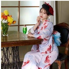
オリジナル浴衣・半巾帯セット 「あぶ金魚」 33,000 円

さらに、着付けやお手入れが簡単で、今話題を集めている「セパレート浴衣」も展開。浴衣初心者の方にも気軽に楽しんでいただける、浴衣専門ショップです。