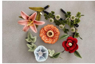
立体刺繍の華アクセサリー 27,500～38,500 円