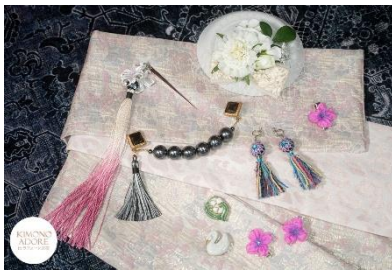
半幅帯ピンクレオパード 9,900 円 百合の簪 5,800 円 羽織クリップ アンティークボタン 13,200 円

作家の感性と技術が光る、一点物の着物や帯が集結。作品を手にとれるだけでなく、着物好きの作家へ直接オーダーできる販売会です。着物や帯は好きな色やサイズで仕立てることができ、自分だけの一着を実現。カジュアルからフォーマルまで、世界にひとつだけの着物スタイルをご提案します。