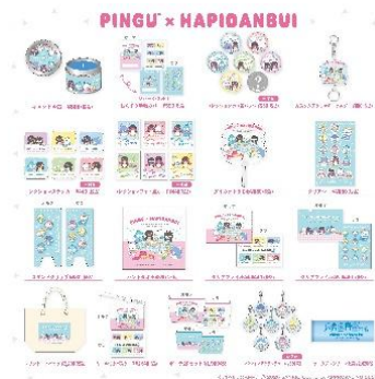
「ピングー」×「はぴだんぶい」 コラボレーショングッズ