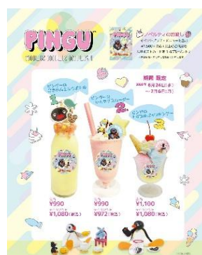
カフェ限定メニュー