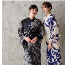
キャロル 66,000 円