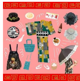
浴衣 29,700 円～