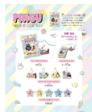
カフェ限定グッズ