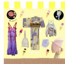
浴衣 29,700 円～