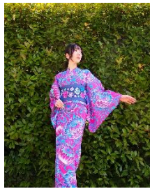
浴衣「velvet flower」/半幅帯「多肉」 浴衣 55,000 円/半幅帯 26,400 円

着物デザイナー石川成俊が手掛けるブランド「iroca」が期間限定ショップをオープン。「サイケデリック」をテーマに、花と深海という二つの世界観を表現した新作浴衣や新作帯を展開するほか、約20柄のオリジナルデザイン浴衣を販売。ゲストブランドとして立体刺繍作家「PieniSieni」も参加し、花をモチーフにしたアクセサリーなど、夏の装いを彩るアイテムを取り揃えます。