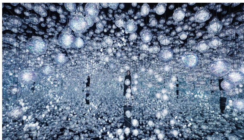
チームラボ《Bubble Universe: 光の球体結晶、ぶるんぶるんの光、環境が生む光 - ワンストローク》©チームラボ