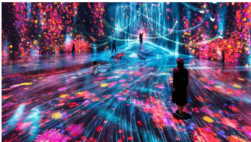
チームラボ《人々のための岩に憑依する滝》、《花と人、コントロールできないけれども共に生きる - A Whole Year per Hour》、《追われるカラス、追うカラスも追われるカラス:境界を越えて飛ぶ》© チームラボ