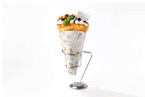
チョコバナナクレープ (1,320円)

旬の国産いちごをふんだんに使い、甘酸っぱい酸味がカスタードの濃厚さを引き立てる華やかなクレープ。