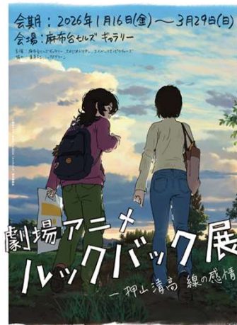
AZABUDAI HILLS GALLERY