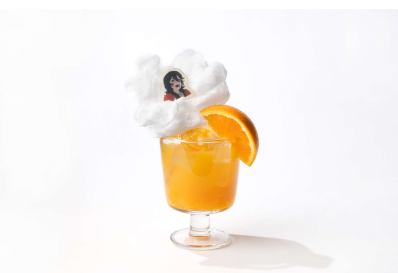
オレンジジュース (1,100円)

藤野が喫茶店で口にしていたコーヒーをイメージ。深い苦みの中にホイップの優しい甘さが溶け合います。