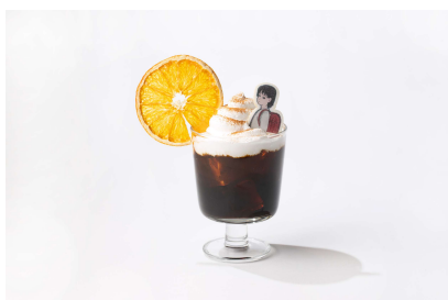
ウィナーコーヒー (1,100円)

バナナを1本まるごと使用。チョコレートホイップや濃厚なショコラブラウニーを合わせた、チョコバナナクレープ。