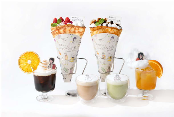
コラボカフェメニュー 一覧(全6種)

麻布台ヒルズギャラリー カフェでは作品の世界観にインスパイアされたコラボメニューを展開します。作品内で二人が「生クリーム食べに行こうぜ！」と街に繰り出すシーンで登場するクレープ、カフェで飲んでいたオレンジジュースやコーヒー、さらには原画をあしらったラテなどを展開します。(金額はすべて税込表記)