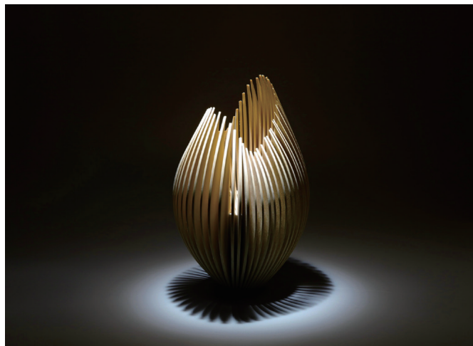
Bone Flower_NotoHiba (2024) ©Kensei Hanafusa

甚大な被害をもたらした能登半島地震を契機に生まれた最新作のお披露目の他、作品の販売、トークイベント、被災地において心のよりどころとなっている「インスタントハウス」内での復興祈願チャリティ茶会を行います。