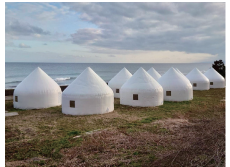
撮影場所 能登半島 能登町