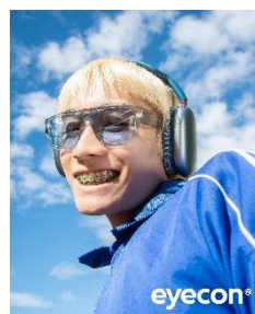
【Goggley Teardrop】MODE series 2,980円(税込)