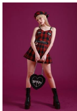
トップス 9,900円(税込) スカート 13,200円(税込)