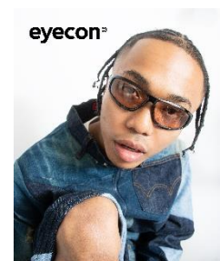
【SPORTS Type】Modern series 2,980円(税込)