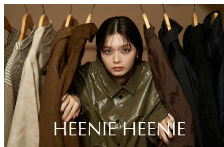
Asymmetry Tuck PU Leather Jacket 7,980 円(税込)