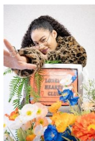
【Metal square】Y2K series 2,480円(税込)