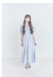
「erii(えりい)」 オフショルダー フィットフレアワンピース 15,000 円(税込)