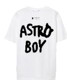
©乾シンイチロウ × 手塚治虫コラボレーション ティーシャツ ※枚数限定 11,000 円(税込)