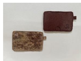
ノベルティ オリジナル本革カードケース