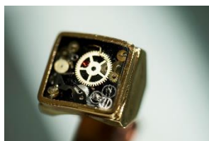
ビンテージ時計リング 20,130 円(税込)