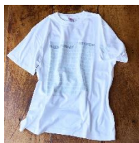
オリジナル T シャツ 白 6,000円(税込)