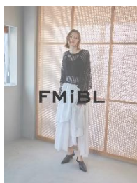
「FMiBL(ファミル)」 メッシュカーデ 12,000 円(税込) ティアードスカート 19,000 円(税込)

5.27(Sat)~5.29(Mon) パフォーマー重留真波プロデュース「MaSh LYFE94」