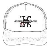
メッシュキャップ