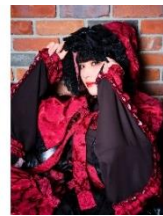
HELI-X 黒 Ver Rose Red Madness 薔薇色の憤怒(ATELIER PIERROT / HELI-X EX.) 29,920円(税込)