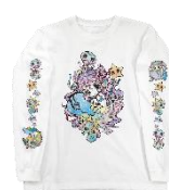
せきやゆりえ マーメイドロングティーシャツ 16,500 円(税込)