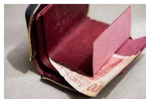
ガウディ革財布 14,300~18,700 円(税込)