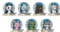
アクリルスタンド

2023.5.18(Thu)–5.29(Mon) 5F MAKE THE STAGE