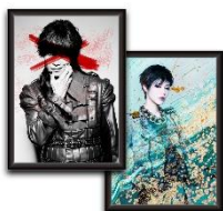
額装特殊グロスプリントアルミ複合版 45,000円(税込)