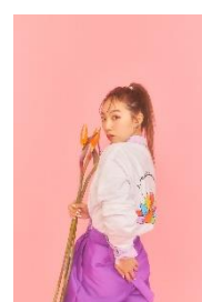
「MaSh LYFE94」 バックプリントロング T シャツ 8,182 円(税込)