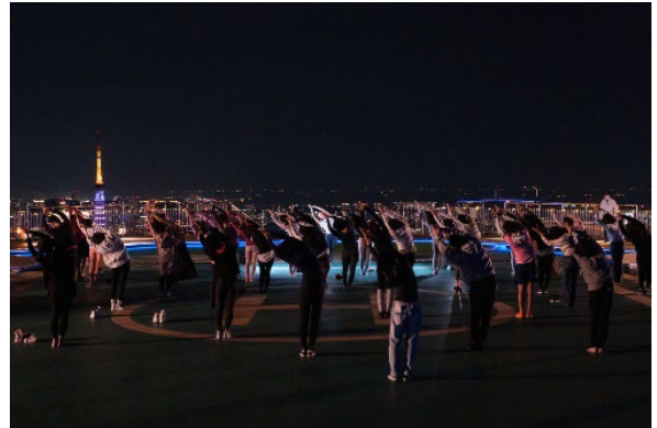
2022年10月開催 スカイデッキヨガより (「天空のスターキャンプ」スカイデッキ、2022年)

料 金: 3,500円(52階 東京シティビュー+スカイデッキの入場料含む) 参加方法: 要事前申込 ※申込は4月24日(月)16:00より先着順。定員に達し次第受付を終了します。 詳 細: https://tcv.roppongihills.com/jp/exhibitions/hsd2023/ ※雨天、荒天時は中止。 ※ヨガはマットを使用しないで行います。