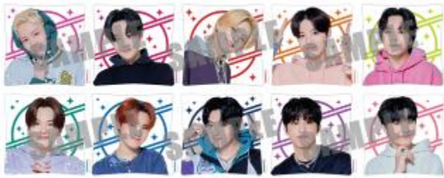
クッション(メンバー別 10種)