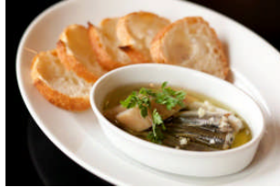
ゴールデンブラウン (本館 3F)

ヘルシーな寒天を使った三種類のミニ和スイーツとドリンクのセット。美しい海の中をイメージしたあんみつは、さわやかなすだち風味の蜜とともに。他の二つはフルーティーな香りと小豆を合わせたスイーツ。