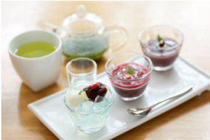
R style by 両口屋是清 (本館 3F)

～海の恵・寒天で作った～ フルーティー和スイーツと ドリンクセット ¥1,500(税込)