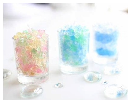
手作りキャンドル教室