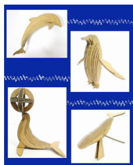
ダンボールで「海の仲間たち」を作ろう！