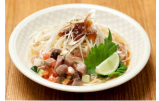
ラーメンゼロ PLUS (本館 3F)

トロピカルリキュールと桃のピューレを使い、美しい海のブルーと砂浜のピンクをイメージしたカクテル。フルーツもたっぷり使用し、夏の海にいるような気分させてくれる。見た目も美しい一杯。 (提供時間 17:00～)