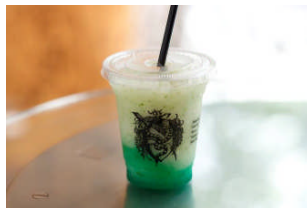
フォービドゥン フルーツ (西館 1F)

ドイツ直輸入のスパークリングワイン(ゼクト)にブルーキュラソー(オレンジのリキュール)を加え、美しい海をイメージした限定ドリンク。はじけるのど越しと、青から緑に変わる色の変化をお楽しみ頂けます。 (提供時間 17:00～)