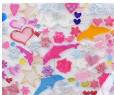
GelGems アートをつくろう！