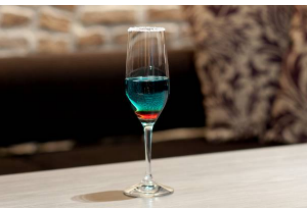
ドイチェ・ドイチェ (本館 B3F)

冷たい白ワインのゼリーに桃のコンポートとパニラアイス、ヤシの木に見立てたチョコレートをトッピング。青いフルーツシロップをゼリーに流し込み、南国に浮かんだ小さな島をイメージ。 (提供時間 14:00～)