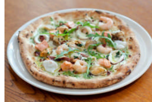
サルヴァトーレ クオモ (本館 3F)

新鮮なイワシを使った、自家製のオイルサーディンと、しっとりジューシーなニシンの燻製をバゲットと一緒に。キンキンに冷えたビールやワインのお供にぴったりの一品です。 (提供時間 15:00～)