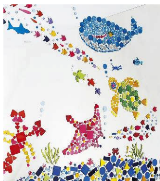
GelGems によるフォトスポット ※イメージ