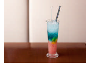
洋食ミヤシタ (本館 3F)

エメラルドグリーンの浜辺をイメージした色鮮やかなライムスムージー。瑞々しい果実と爽やかなライムピールの後味がやみつきです。