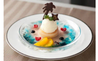
デルレイ カフェ & ショコラティエ (本館 3F)

海苔のクリームの上に魚介類をふんだんにトッピングし、燻製のモッツアレラチーズで仕上げた表参道ヒルズ限定のピッツァ。夏の海を連想させる、風味豊かで贅沢な味わい。 (提供時間 17:00～)