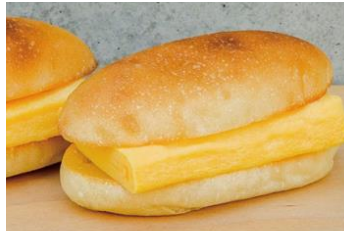
すしやの玉子サンド