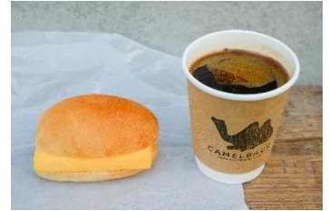
すしやの玉子サンドとドリップコーヒー 玉子サンド¥400 ドリップコーヒー¥400