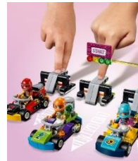
LEGO, the LEGO logo and FRIENDS logo are trademarks of the LEGO Group. ©2018 The LEGO Group.