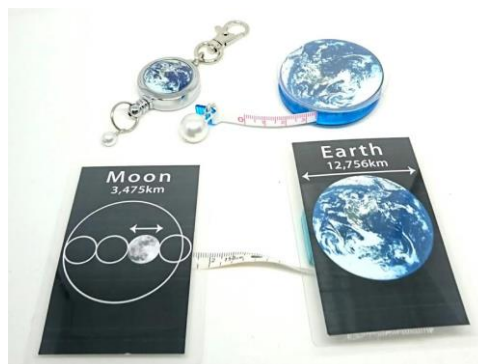
地球と月のメジャー ※イメージ

日 時： 8月17日(金)15:00～ / 16:00～ ※各回30分 場 所： プレゼンテーションルーム(森タワー3F) 申込方法： 東京シティビュー公式サイトよりご確認ください 申込期間： 7月23日(月)～7月31日(火) 料 金： 500円 推奨年齢： 小学1～6年生(6～12歳) 定 員： 30名 お問い合わせ先： 03-6406-6652