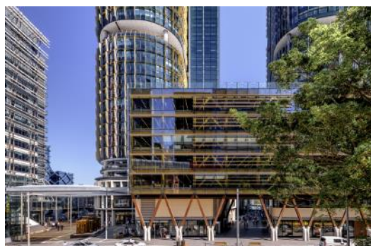
「インターナショナル・ハウス」 バンガルー、シドニー、ニュー・サウス・ウェールズ州、 (建築家：ツァネス、レンドリース)