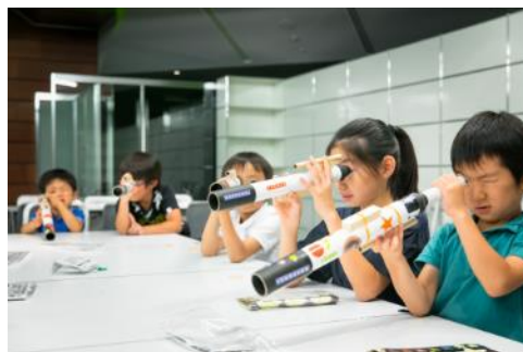
「わくわくドキドキ星空観察 天体望遠鏡をつくろう！」の様子

日 時： 8月1日(水)16:30～19:00 場 所： プレゼンテーションルーム(森タワー3F) 申込方法： 東京シティビュー公式サイトよりご確認ください (7月上旬公開予定) 申込期間： 7月9日(月)～7月17日(火) 料 金： 4,000円※参加されるお子様のスカイデッキまでの入館料含む 推奨年齢： 小学1～6年生(6～12歳) 定 員： 30名 お問い合わせ先： 03-6406-6652