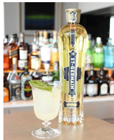
限定オリジナルカクテル 『エルダーフラワー&シトラス』

提供期間： 6月4日(月)～8月31日(金) 提供時間： THE MOON Lounge 11:30～LO22:30(休前日 24:30) Restaurant THE MOON ランチ 11:30～15:30 ディナー 18:00～23:00