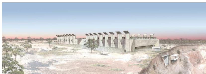
「オーストラリアン・オパール・センター」 ライトニング・リッジ、ニュー・サウス・ウェールズ州、 (建築家：ウエンディ・ルーウィン、グレン・マーカット)