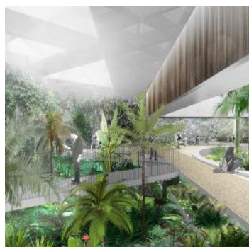
「イアン・ポッター国立温室」 オーストラリア国立植物園、 キャンベラ、オーストラリア首都特別地域、 (建築家：CHROFI)