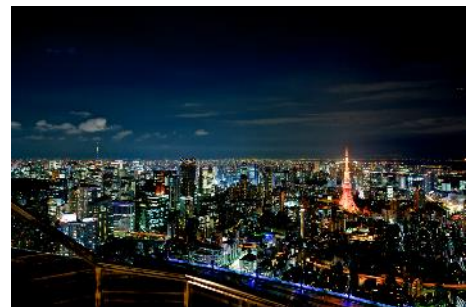
屋上「スカイデッキ」から見える夜景

期 間： 7 月 14 日(土) ～ 8 月 26 日(日) 時 間： 11:00～22:00(最終入場 21:30) 場 所： 東京シティビュー「スカイデッキ」(森タワー屋上) ※スカイデッキまでの入場料(一般 2,300 円)が必要です。 ※強風、雨天、荒天時はクローズとなります。