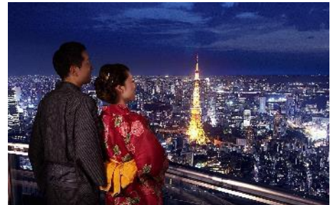
「浴衣 DE 無料！スカイデッキ」※イメージ

期 間： 7 月 14 日(土) ～ 8 月 26 日(日) 場 所： 東京シティビュー「スカイデッキ」(森タワー屋上) 内 容： 浴衣でご来場のお客様(甚平等も可)は「スカイデッキ」 入場料(一般 500 円、子供 300 円)が無料 ※ただし、展望台入館料(一般 1,800 円)が必要です。 ※強風、雨天、荒天時はクローズとなります。