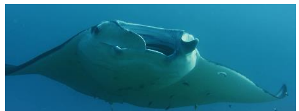
③ 大迫力！ザトウクジラやマンタの遊泳映像

「 さわ 触れる地球」を体験しつつ、海と地球について学ぶ「子ども地球教室」を開催。専門家による海の生き物についてのレクチャーにより、海を豊かにするサンゴ礁の大切な役割、サメとクジラの秘密など楽しく学べます。さらに、地球の成り立ちや地球環境問題についてお子様にも分かりやすくレクチャーします。