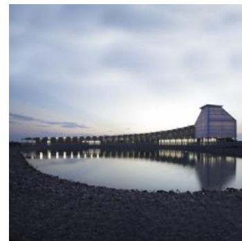
「レス・ウィルソン・バラムディー・ティスカマリ・センター」 カルンバ、ケープ・ヨーク、クイーンズランド州、 (建築家：パッド・プラナガン)