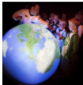
① デジタル地球儀「 さわ 触れる地球」 オランダ国立科学博物館での 展示風景

沖縄美ら海水族館の協力により、美しいフォルムの巨大な水槽が登場。トラフザメの幼魚、ヒトデ、カクレマノミ、チンアナゴ、ルリスズメダイ、ハリセンボンなど、色とりどりの魚による海の世界をご覧ください。 ※展示生物は変更になる場合がございます。