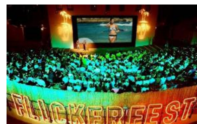
オーストラリア・ショート・フィルム・フェスティバル in 六本木のイメージ

詳 細： https://australianow2018.com/program/australian-short-film-theatre-in-roppongi