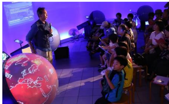
④「子ども地球教室」 ※イメージ

開催日：7月14日(土)、15(日)、21(土)、22(日)、28(土)、29(日)、 8月4日(土)、5(日)、11(土)、12(日)、18(土)、19(日)、25(土)、26(日) 時間：11:00～11:45 場所：六本木ヒルズ展望台 東京シティビュー スカイギャラリー1(東京タワー・お台場方面) 申込方法：事前申込制(先着順) 東京シティビューWEB(tcv.roppongihills.com) 申込期間：ご予約はワークショップの前日まで受付けております。 ※空きがあれば当日参加も可能です(先着順) 応募期間：6月23日(土)～ 料金：無料 ※ただし、展望台入館料が必要です。 推奨年齢：小学校高学年以上 大人の方のみでも参加可能です。 定員：20名+保護者 お問い合わせ先：03-6406-6652