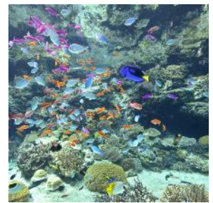
② 色とりどりの海の生物 ※イメージ