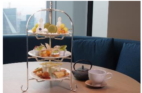
『果実メロンとピスタチオの AfterMOON Tea Set』