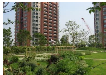
六本木ヒルズけやき坂コンプレックス 屋上庭園

日時:6月21日(木)、6月22日(金) 時間:19:30～ ※両日とも荒天時中止 場所:六本木ヒルズけやき坂コンプレックス「屋上庭園」(通常非公開) 対象:森ビルのオフィスで働くワーカー 各40名(要事前申込み) 詳細はワーカー専用サイトをご覧ください。