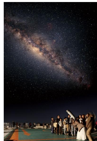
「スカイデッキ星空観望会」の様子 (イメージ)

日時:6月21日(木)、7月7日(土) 時間:20:00～22:00 ※最終入場は21:30まで、両日とも雨天・曇天時中止 会場:東京シティビュー「スカイデッキ」(六本木ヒルズ 森タワー屋上) 費用:無料 ※ただし、スカイデッキまでの入場料(一般2,300円)が必要です。 参加方法:参加自由(開催時間内に各会場へお越しください)