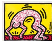
ポスター Club DV8 Unveils the Keith Haring Room, 1986

ヘリングがデザインを手がけたハウスミュージック、パンクロックやヒップホップなどのレコード・カバーを13点展示。