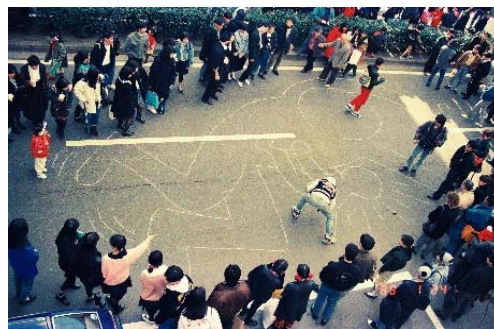
表参道で披露したパフォーマンスの写真(世界初公開) 1988

本展では、中村キース・ヘリング美術館が所蔵するオリジナル・ポスターをはじめ、ハウスミュージックやパンクロックのレコード・カバーなど、約70点を東京で初展示。また、彼が表参道の路上にドローイングする貴重な姿を捉えた秘蔵写真約30点を世界初公開します。その他、会場内には《ポップショップ》を彷彿させるブースが登場し、グッズ販売も実施。アートを通して多くの人とコミュニケーションをとりたいという願望を持っていたヘリングが、ドローイングのパフォーマンスを通し、人々と言葉を超えたコミュニケーションを図った思い出のストリート、表参道。そのシンボルとして、アートやカルチャーを発信し続ける表参道ヒルズで開催される本展にて、ヘリングが生涯をかけて送り続けたメッセージに思いを馳せつつ貴重な作品の数々をご堪能ください。