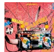
レコード・カバー Duck Rock, Malcolm McLaren, 1983

《ポップショップ》を再現したブースで世界中から集めたキース・ヘリンググッズを販売。東京ではここでしか手に入らないグッズ販売コーナーを展開。