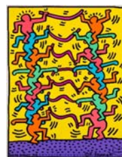
ポスター Keith Haring for Emporium Capwell, 1985

ヘリングが手がけたオリジナル・ポスターを58点展示。核放棄、反アパルトヘイト、エイズ予防や、LGBTのカミングアウトを促すナショナル・カミングアウト・デーなどの社会的な作品から、アブソルート・ウォッカやスウォッチなどの商業的な作品、展覧会やクラブ・イベントの告知等、多様なオリジナル・ポスターを展示。