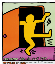
ポスター National Coming Out Day... 1988