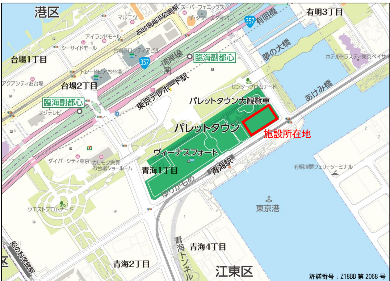
お台場周辺エリア