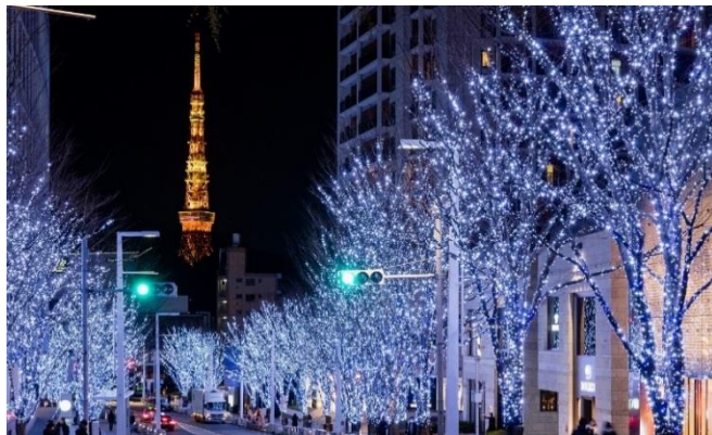
白色と青色のLED“SNOW&BLUE”(昨年の様子)

Galaxyと9年目のコラボレーションを迎える今年も、けやき坂に煌くイルミネーションをお届けします。3年ぶりに国内発売された同社の最新スマートフォン“Galaxy Note8”をはじめとした各製品は、ハイスパックかつ便利な機能を搭載し、多くのお客様にご好評いただいています。また、今年はヒルズカフェ/スペースに製品体験ができる場所(Galaxy Studio)として様々なアトラクションを用意し、訪れるお客様にあつと驚く素敵な時間をご提供いたします。