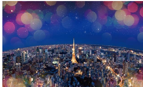
「天空のクリスマス 2017」※イメージ

六本木ヒルズ展望台 東京シティビューでは、11月25日(土)～12月25日(月)の期間、煌めく夜景とともに華やかなクリスマスを演出する「天空のクリスマス 2017」を開催します。今年は、海拔 270m にある屋上スカイデッキで『星空のイルミネーション』を初開催。通常入ることの出来ないスカイデッキのヘリポートに立つと、まるで流れ星に包まれているかのように、5分に一度効果音に合わせてスカイデッキをぐるりと光が煌めきます。都会の大パノラマ夜景の中で、大平貴之氏監修のイルミネーションや、上空などにタブレット(貸出)をかざすと「屋上に帰ってきた 星にタッチパネル劇場」をお楽しみいただけます。これは、おおぐま座、おうし座など、星座の動物たちが立体的に浮かび上がり、スカイデッキに招かれた動物たちと一緒に冬の星空の下を散歩したり、実際の観測データに即した天球を出現させたり、天動説と地動説を切り替えたり、“凝縮した宇宙空間”に入ったかのような感覚になれる、AR 三兄弟による最新技術が施されたオリジナルの最新 AR 体験です。『星空のイルミネーション』開催期間中は、スカイデッキの営業時間を 22:00 まで延長し、冬の煌めく夜景とイルミネーションを心ゆくまでご堪能いただけます。