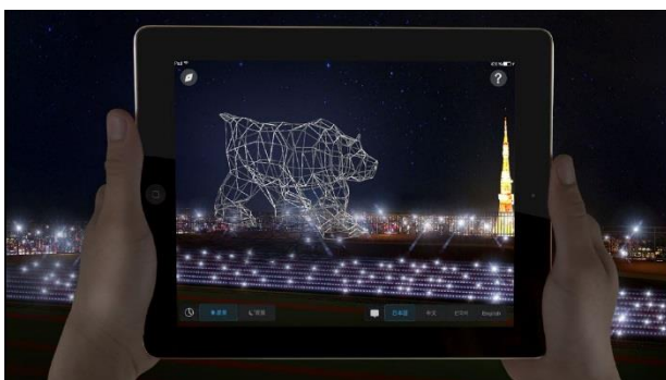
イルミネーションとARのおおぐま座をタブレットで見ている様子 ※画像はAR三兄弟の「凝縮現実」のイメージです。 実際にドームや星座があるわけではありません。

また、東京シティビュー52階の屋内展望回廊では、ローマから始まったブルガリの巡回展「ブルガリ セルペンティフォーム アート ジュエリー デザイン」を開催します。ブルガリによるクリスマスツリーが登場し、天空のクリスマスに一層の輝きを添えます。この冬、東京シティビューは煌めくジュエリーやロマンティックな演出とともに、『天空のクリスマス 2017』をお届けします。