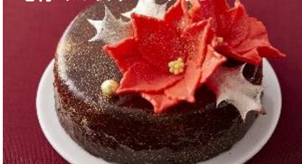
毛利 サルヴァートル クオモ

ふわふわのダックワーズ生地にブラッドオレンジとチョコレートムース、ポインセチアに見立てたチョコレートを添えました。