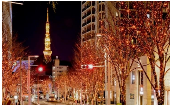
琥珀色とキャンドル色のLED“CANDLE&AMBER”(昨年の様子)