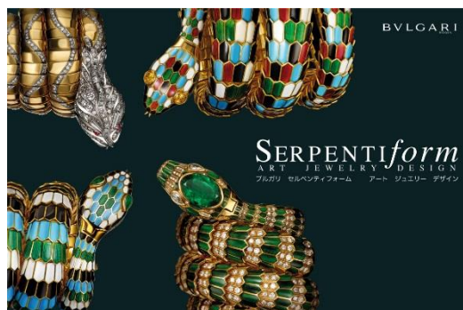
ブルガリ セルペンティフォーム アート ジュエリー デザイン