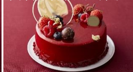
ラ プティグ ドゥ ジョエル・ロブション

タヒチ産バニラクリームにチェリーのクレームブリュレ、キルシュ酒漬けチェリーを重ねた贅沢な組み合わせのビターチョコレートのムース。※11/21(火)～予約開始