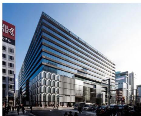
GINZA SIX 外観

銀座エリア最大規模の複合施設「GINZA SIX」は、2つの街区(約1.4ha)を一体的に整備した再開発事業により、商業施設やオフィス、文化・交流施設などの多彩な都市機能とともに、屋上庭園や観光バス乗降所、安全で快適な交通・歩行者ネットワーク、また、非常用発電設備や防災用備蓄倉庫等の防災支援機能等も整備しております。