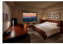
グランド ハイアット 東京 グランドルームの宿泊券 (2 名 1 室利用)

※レシートを抽選会場にお持ちください。(複数店舗合算可) ※抽選はお 1 人様 1 回となります。 ※賞品がなくなり次第終了となりますので予めご了承ください。