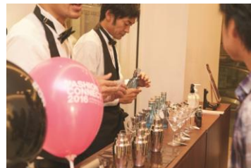
オデット エ オディール 限定フレグランスバー