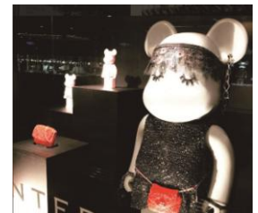
アンテプリマ ベアブリックのフォトスポット

<サービス(一例)> ※実施時間は、店舗によって異なります。なくなり次第終了のサービスもございます。