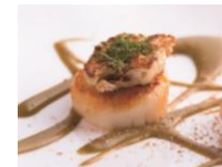
ジャン・ジョルジュ 東京 ディナーペアコースチケット