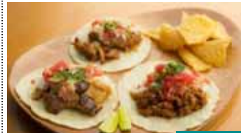
タコリッコ タコス食べ比べ 1,000円