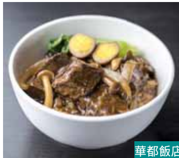
華都飯店 中華風牛丼 800円