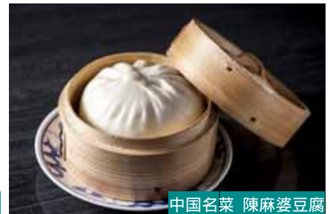
中国名菜 陳麻婆豆腐 肉まん 400円