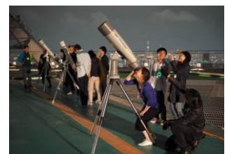
六本木ヒルズ屋上「スカイデッキ」 星空観望会の様子

6/21(水)・7/7(金)には、六本木ヒルズ屋上「スカイデッキ」(東京シティビュー)にて、六本木天文クラブによる「星空観望会」を実施いたします。当展望台は、海拔 270m、オープンエア形式の展望施設として、関東一の高さに位置しているため、周りに遮るものが何もなく、空を広く見渡せ、より近くに感じることができます。また、特別実施日の夜はライトダウンにより、東京タワーをはじめ街の明かりが消灯されるため、瞬く星が普段よりも際立って鮮やかにくっきりとご覧いただけます。